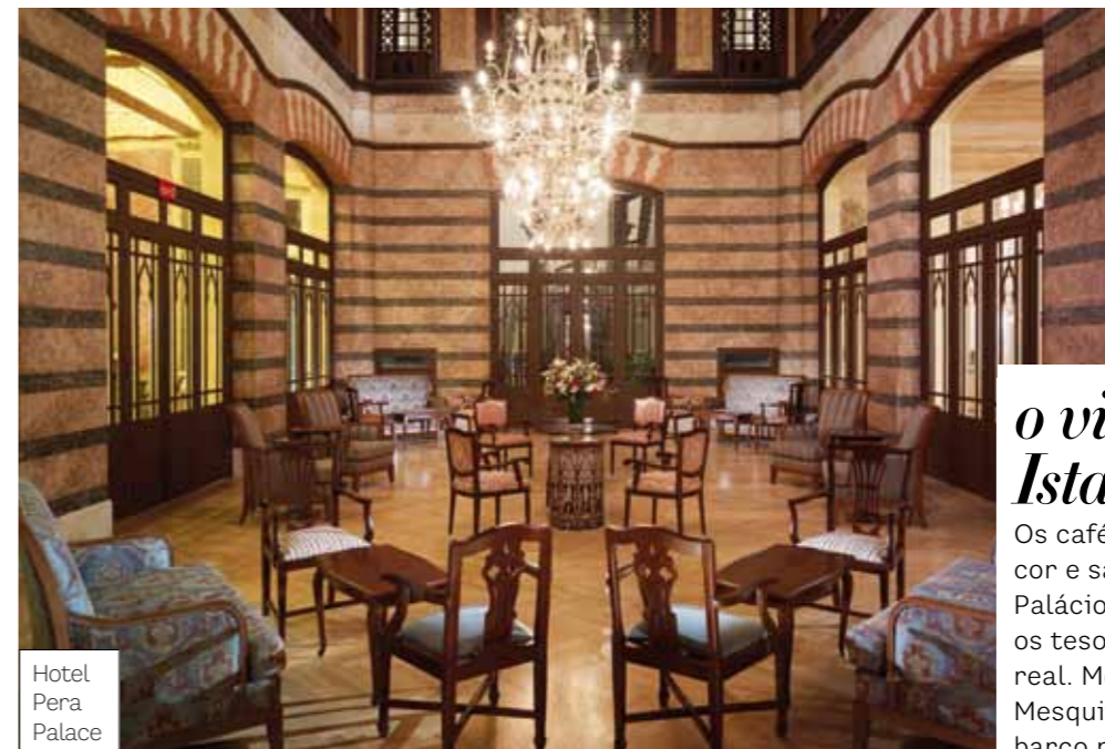
Hotel Pera Palace

Reserve um dia para se perder no mercado Kapali Çarsi, ou Grande Bazar. Com milhares de produtos em suas mais de quatro mil lojinhas, o lugar é uma experiência única para quem gosta de aromas e temperos.